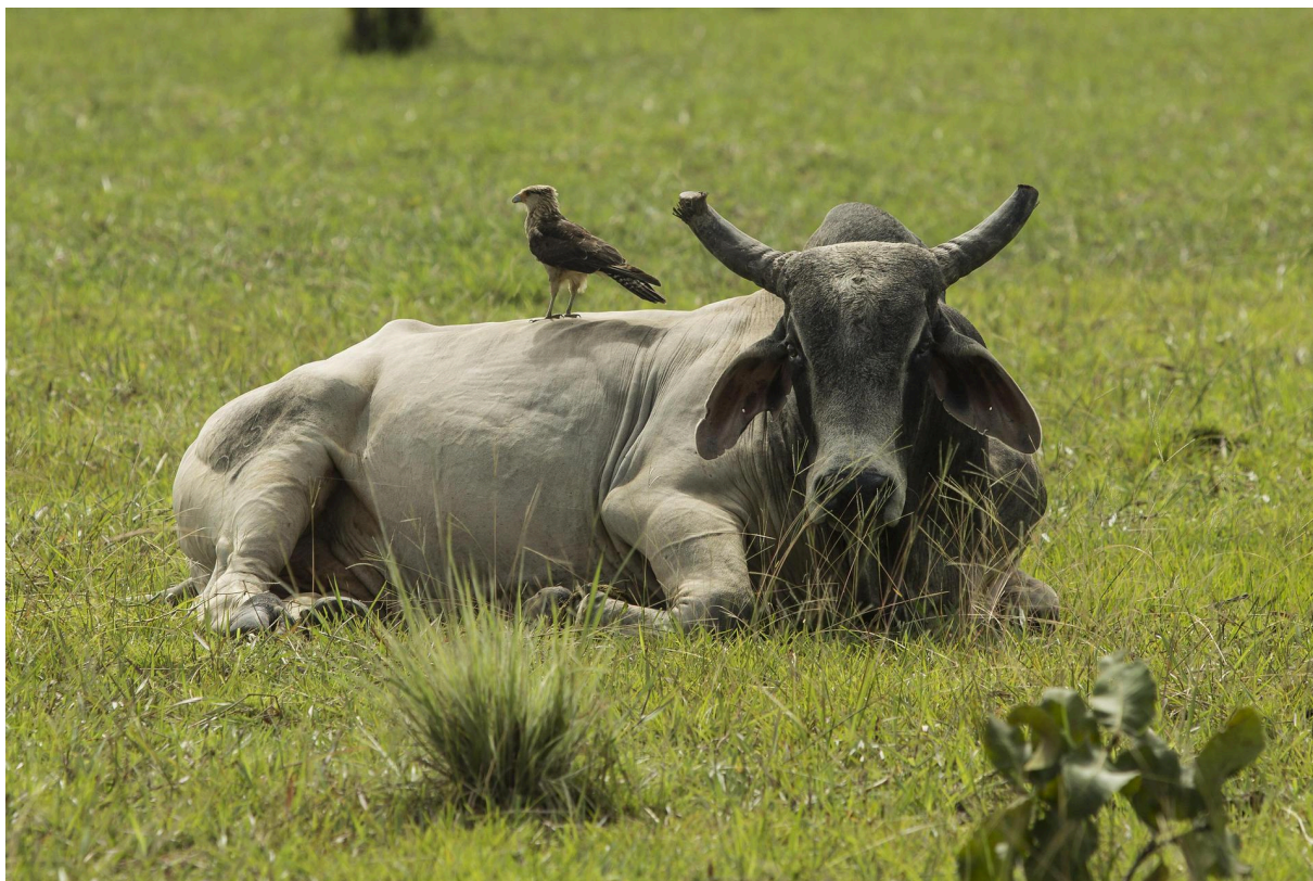
La vache se repose avec un oiseau sur le dos, montrant la diversité animale dans les systèmes de pâturage ouverts.