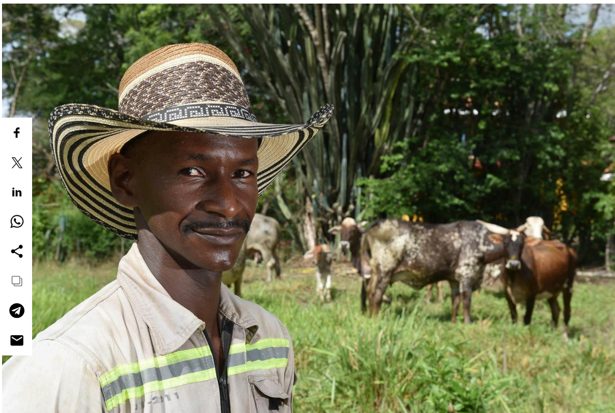
Un agriculteur dans son système de pâturage sylvopastoral en Colombie.

Dans cet article, nous explorerons les principales pratiques d'élevage durable qui contribuent à la résilience, en veillant à ce que les innovations agricoles permettent à l'agriculture non seulement de faire face à des défis tels que le changement climatique, les pressions économiques et les contraintes en ressources, mais aussi d'y contribuer positivement.