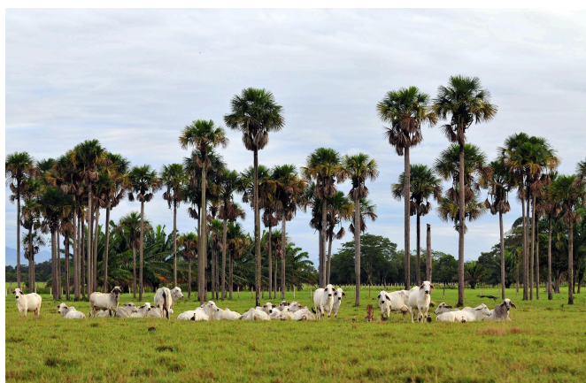
Un troupeau de vaches broute et se repose parmi les arbres dans l'est de la Colombie.