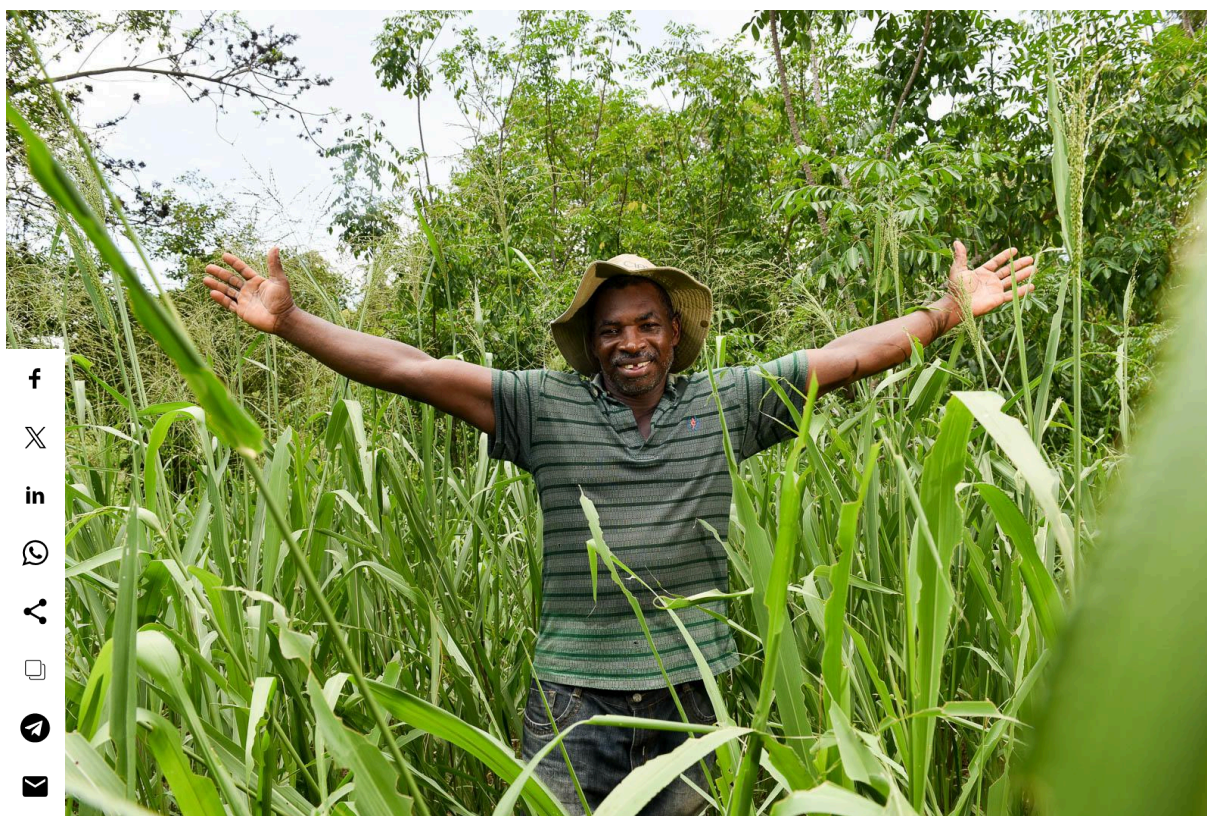
Un agriculteur célèbre sa récolte de fourrages améliorés pour son système sylvo-pastoral en Colombie.

Investir dans le bien-être animal mène à une meilleure productivité à long terme et à la confiance des consommateurs, à mesure que de plus en plus de personnes se préoccupent des aspects éthiques de la production alimentaire. En plus des considérations éthiques, l'amélioration du bien-être animal présente plusieurs avantages pratiques pour les éleveur.se.s : l'intérêt croissant des consommateurs pour des pratiques plus éthiques offre également des opportunités de revenus pour les éleveur.se.s qui donnent la priorité au bien-être animal.