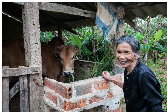
Une femme donne des fourrages améliorés à ses vaches au Vietnam, suite à une formation sur la gestion intégrée de la fertilité des sols.