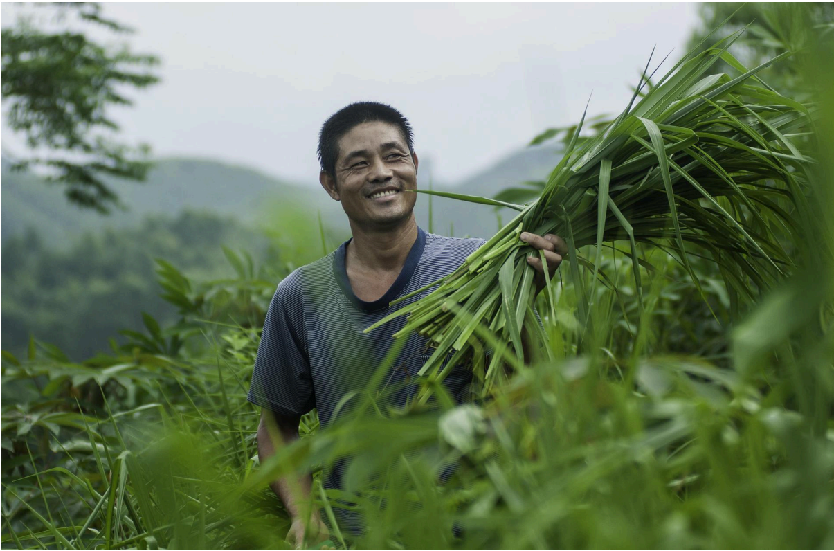
Un agriculteur vietnamien récolte des fourrages pour nourrir son bétail.