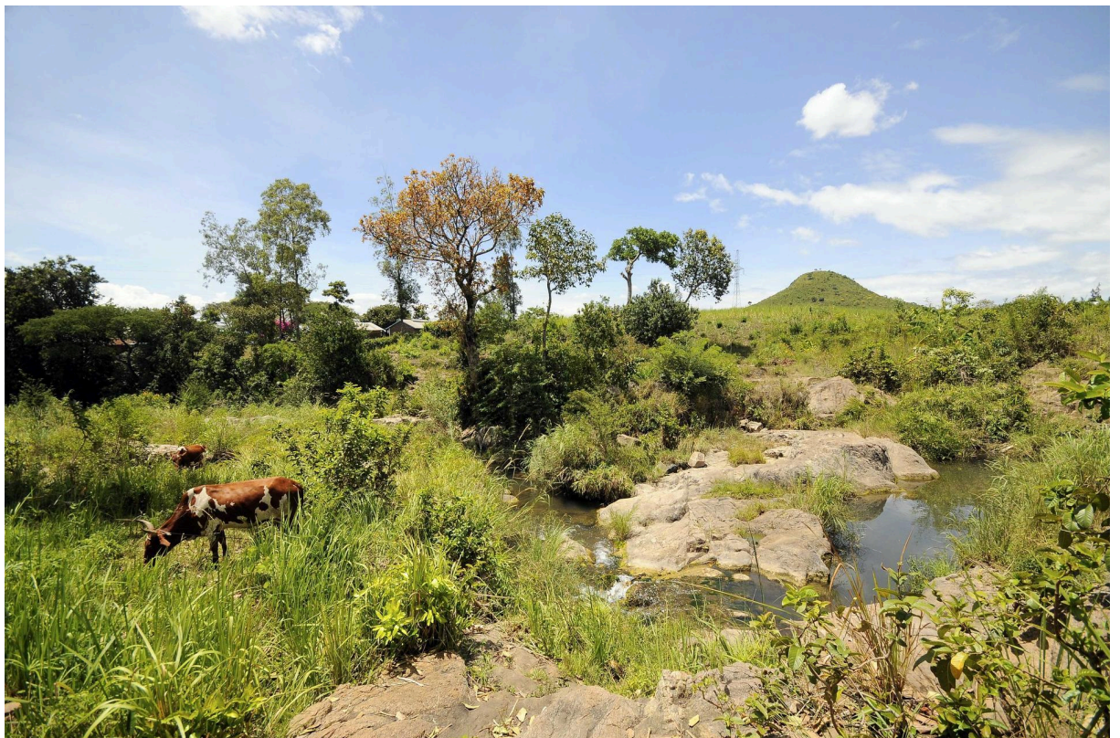
Les vaches paissent librement sur un paysage naturel diversifié au Kenya.

Contrairement aux méthodes conventionnelles d'élevage actuelles, l'élevage durable intègre des facteurs environnementaux, sociaux et économiques dans les systèmes de production animale, minimisant ainsi les impacts négatifs sur les écosystèmes, conservant les ressources naturelles et améliorant le bien-être animal. L'élevage durable repose souvent sur les méthodes suivantes qui réduisent la pollution, préservent l'eau et minimisent l'utilisation d'intrants chimiques agricoles :